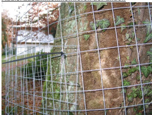
Abb.5: Zusammenmontieren der Enden