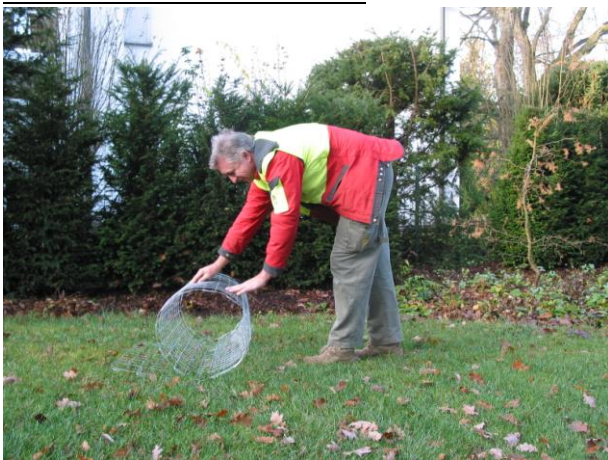
Abb. 3: Vorrollen des Gitters