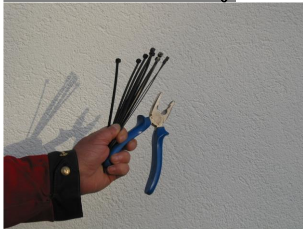
Abb.2: Kabelbinder und Kombizange